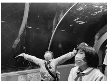
修学旅行（もぐらんびあ）