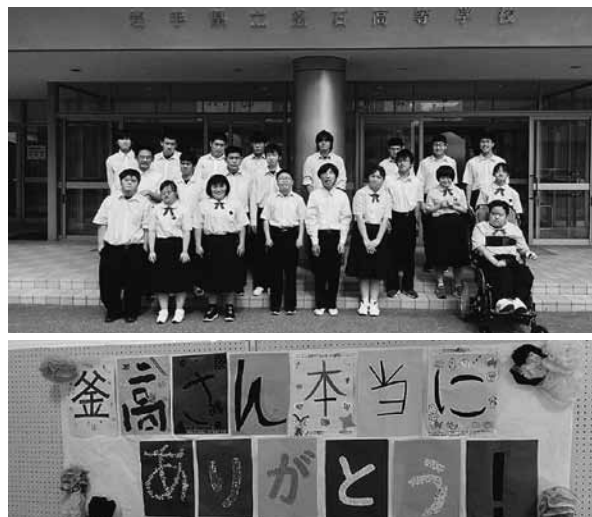
(上) 7月まで学習した釜石高校前にて (下) 釜石高校へ感謝を込めた横断幕