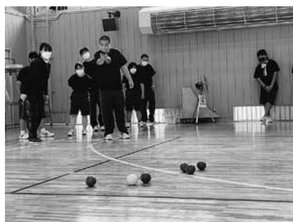
校内スポーツ大会（ポッチャ）