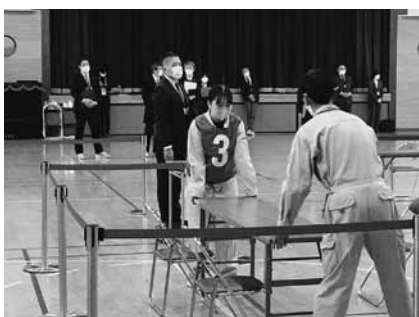
技能認定会 沿岸南部会場