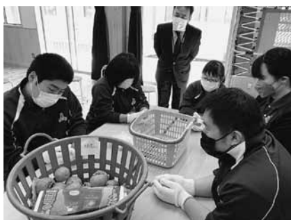
農福連携（甲子柿磨き）